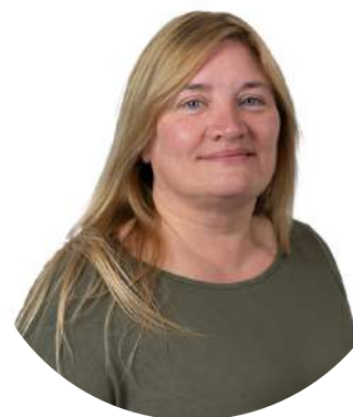
Ms Stephanides School Nurse

If a child is absent due to illness, parents/guardians should email the class tutor , stating the reason for absence. Prolonged or chronic illness of over three days duration must be supported by a doctor's note.