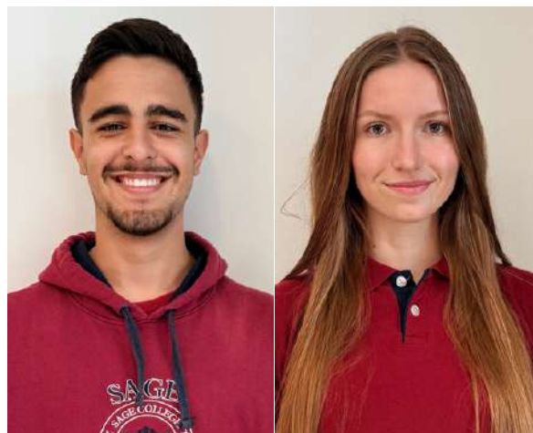
Year 25/26 Head Boy and Head Girl