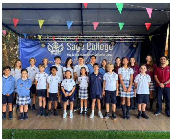
Year 25/26 Student Council